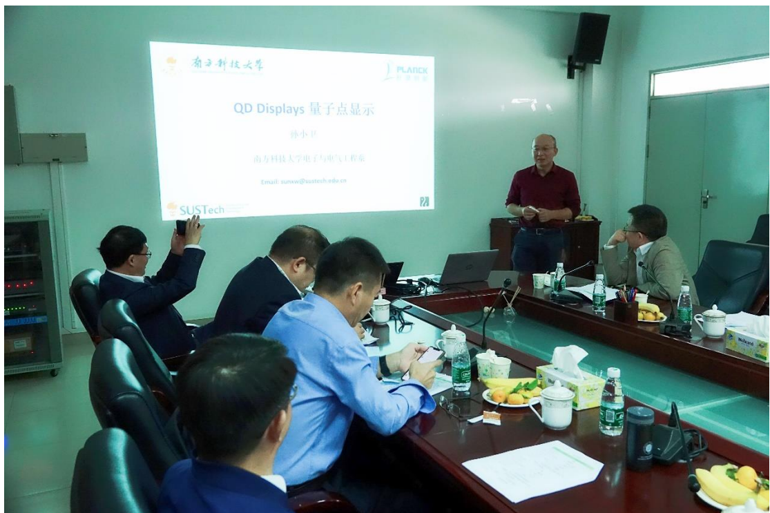
南方科技大学工学院执行院长孙小卫教授作报告