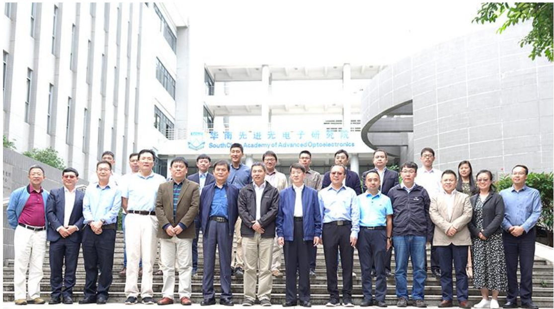
第四届广东光子学与技术协同创新高端论坛参会人员合影

受邀参加该论坛的 20 多位国家杰青、长江学者特聘教授、国家特聘专家、学院（研究院）院长及青年人才等分别来自暨南大学、华南师范大学、深圳大学、华南理工大学、中山大学、南方科技大学、广东工业大学、电子科大中山学院。